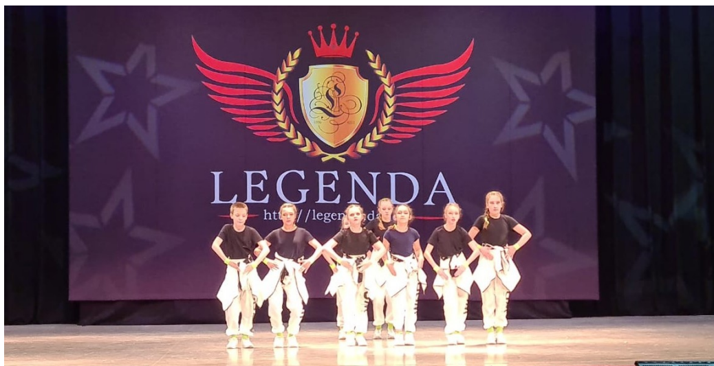
Всероссийский танцевальный чемпионат «LEGENDA»